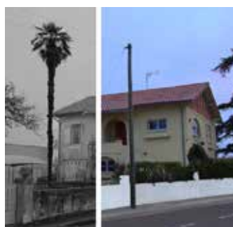
Accompagner la réhabilitation.

Le pôle « réhabilitation de l'habitat urbain et rural » accompagne et réalise la réhabilitation de