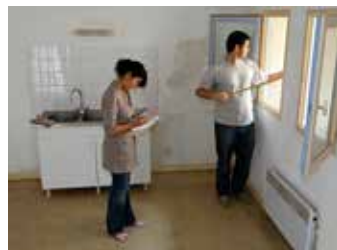
Reloger et accompagner.

Le pôle « gestion locative et service immobilier rural et social » assure deux types de missions.