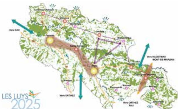
Planifier, aménager les territoires.

Tél. 05 58 90 90 57 urbanisme@pactdeslandes.org