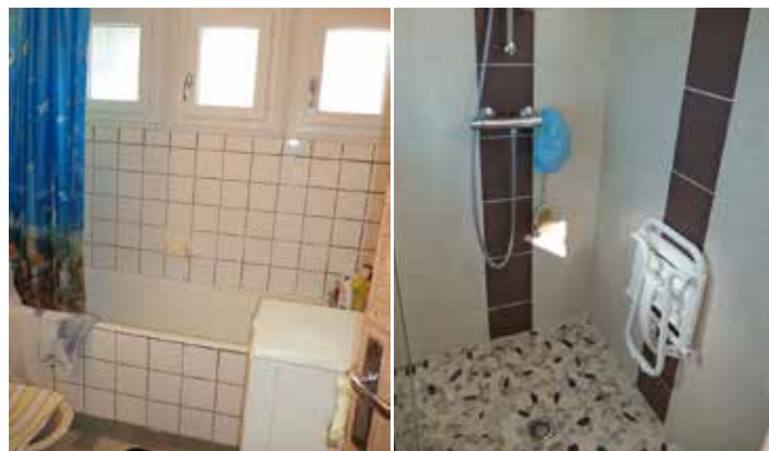
Adapter le logement pour le maintien à domicile des personnes âgées ou handicapées.

736 logements réhabilités dont 570 liés à l'adaptation de l'habitat au vieillissement et au handicap pour le maintien dans les lieux des occupants.