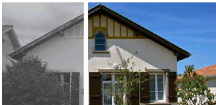
Mettre sur le marché des logements à loyer modéré.

depuis le 8 novembre 1990, pour porter ces opérations de Maîtrise d'Ouvrage d'Insertion. Il sollicite l'UES (Union d'Économie Sociale), structure régionale réunissant les Pact d'Aquitaine Poitou-Charentes et Limousin.